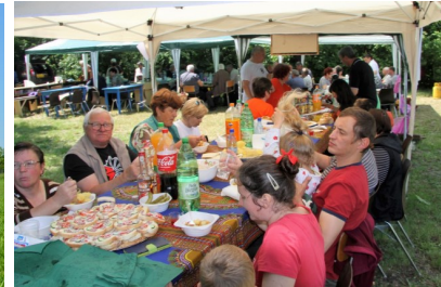
Fettbrot und Gulasch

Im Juni führten Kolping Banat und Kolping Erfurt eine Begegnungs- und Partnerschaftsreise quer durchs Land durch. Ineu - Ruskberg/Rusca Montana - Karansebesch - Kronstadt/Brasov - Oituz - Moldauklöster - Mediasch - Hermannstadt - Temeswar waren die Stationen. In Oituz half man noch den Transporter für den nächsten Hilfstransport in die Ukraine zu beladen und ass mit den Kindern zu Mittag.