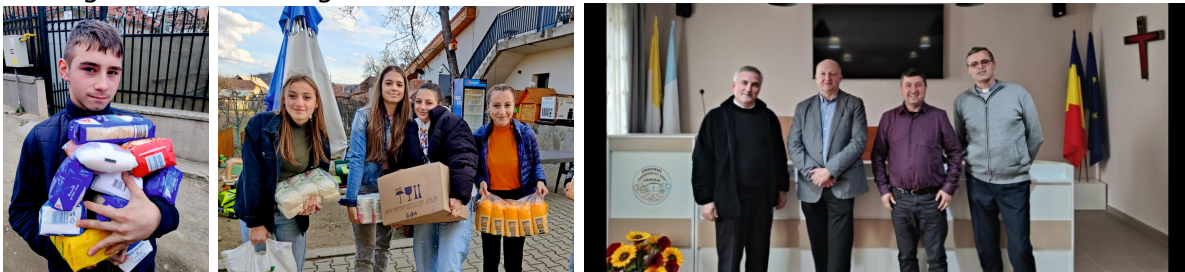
Kolpingjugend Moldau im Einsatz

Für die Fastenzeit gab es für die Jugend aus Oituz eine Solidaritätsübung. Jeweils zu Zweit, wie seinerzeit die Apostel, sollten sie, ohne an die Hilfe der Eltern zu appellieren, in der Gemeinde Lebensmittelpenden für die Kolping Sozialküche in der Ukraine sammeln. Sie brachten tatsächlich 120 l Öl, 120 kg Mehl, 70 kg Maismehl, 120 kg Reis und 120 kg Zucker zusammen.