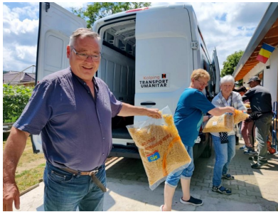
Kolping Erfurt für Kolping Ukraine

Im Juni führten Kolping Banat und Kolping Erfurt eine Begegnungs- und Partnerschaftsreise quer durchs Land durch. Ineu - Ruskberg/Rusca Montana - Karansebesch - Kronstadt/Brasov - Oituz - Moldauklöster - Mediasch - Hermannstadt - Temeswar waren die Stationen. In Oituz half man noch den Transporter für den nächsten Hilfstransport in die Ukraine zu beladen und ass mit den Kindern zu Mittag.