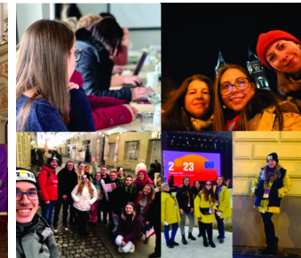
Volontäre, Temeswar 2023