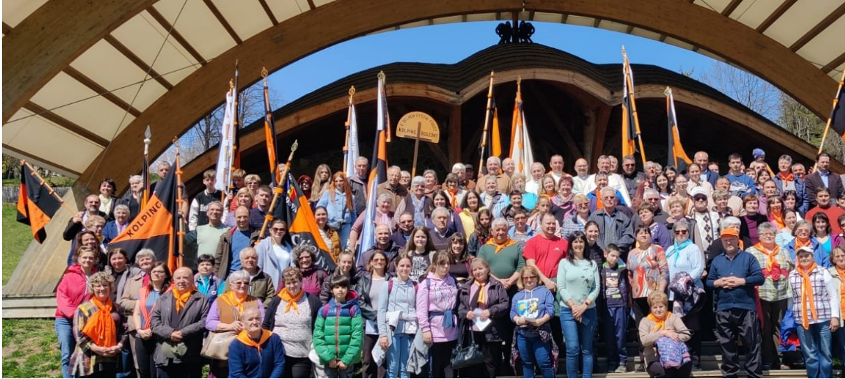
Mitgliederversammlung Kolping Rum'nien, Mai 2023

Im Frühjahr wurde während der diesjährigen Mitgliederversammlung im Wallfahrtsort Schomlenberg/Sumuleu Ciuc der vergangenen 30 Jahre Kolpingarbeit in Rumänien gedacht. Es gab Berichte, gemütliche Erzählrunden und Anekdoten, die Wahl des Vorstandes, beziehungsweise Bestätigung im Amt, Prämierung der Freiwilligenaktionen der Kolpingsfamilien und am Sonntag wurde mitgemacht an der traditionellen 1. Mai-Wallfahrt des Diözesanverbandes Kolping Alba . Kolpinggäste gab es aus Ungarn und Moldawien.