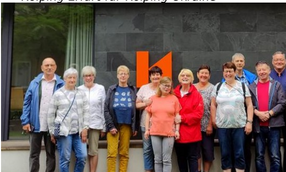
26 Jahre Partnerschaft Kolping Erfurt-Kolping Banat