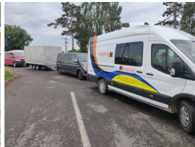
Auf dem Weg...

Geladen werden konnten, wie jedes Mal, wertvolle Gaben, erworben dank des Spendernetzwerkes Kolping International. Übergeben werden konnten Arzneimittel, Verbandsmaterial – einmal auch dank einer grosszügigen Spende des Vereins „Friede und Gutes für Karansebsch“ aus Michelstadt, Deutschland; dann Desinfektions- und Waschmittel, Tourniquets/Aderpressen, feste Schuhe, Bekleidung, Zelte, Campingkocher, Reserve-Gasflaschen, Taschenlampen, Batterien, Rollstühle und Krücken, grössere und kleinere Generatoren, Betten, Matratzen, Bettzeug, Decken, Küchenausstattung und, vor allem - bisher die grösste Menge unserer Gaben: haltbare und frische Lebensmittel für die Kolping Sozialküche in Czernowitz, in der Ukraine.