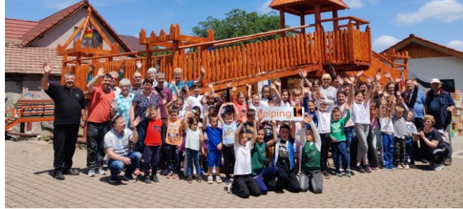
Abschiedsfoto mit Kindern aus Oituz