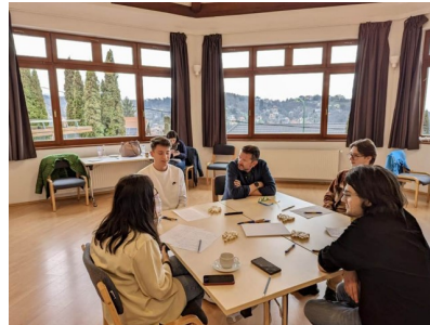
Seminar der KAS-Stiftung