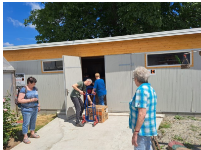
Lagerraum Oituz (anstelle Hühnerstall)