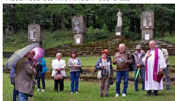
Jährlicher Wallfahrtstag der Banater

Ebenfalls im Juni, im Anschluss an die Begegnung mit Kolping Erfurt fand der „ Maria Radna Wallfahrtstag “ der Kolpingsfamilien aus dem Banat statt.