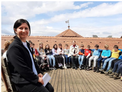
Grundschüler beim Hotelbesuch

12 Schüler dreier Jahrgangsstufen leisteten ihr Praktikum im Kolpinghotel im Schuljahr 2022-2023 ab, im Rahmen ihrer dreijährigen Berufsschulbildung an der staatlichen „Maria Baiulescu“ Schule. In den Osterferien ist Kolping samt einer Grundschule Partner eines Projektes „Verhaltenskodex eines verantwortlichen Touristen“. Im Kolpinghotel erhielten Schüler Hausführungen und nahmen im Restaurant Mahlzeiten ein, in Begleitung des Personals, zur Verdeutlichung der Verhaltenskodexes. Im April durfte das Team des Kolpinghotels Kronstadt Gastgeber für die Demokratie-Seminare der Konrad Adenauer-Stiftung (KAS) sein.