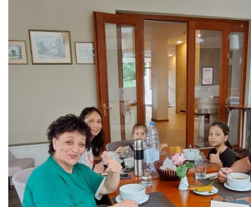
Flüchlinge aus der Ukraine

Für die Kolpingdelegierten aus der Ukraine und Moldawien auf dem Weg zur Kontinentalversammlung in April, in Novi Sad, Serbien konnte im Kolpinghaus in Kronstadt und Temeswar beim Zwischenhalt Herberge und Verpflegung geboten werden. Die durchreisenden Gäste aus der Ukraine organisierten spontan im Flüchtlingsaufnahmezentrum der Stadt Kronstadt ein Dankeschön-Konzert für die Hilfe, die für die Menschen in der Ukraine geleistet wird.