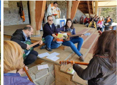
Kreuzweg und Gottesdienst in der Wallfahrtskapelle am Berg