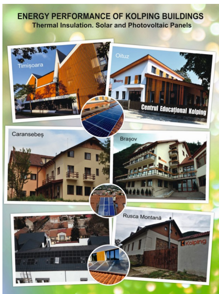
Sonnenenergie für die Kolpinghäuser