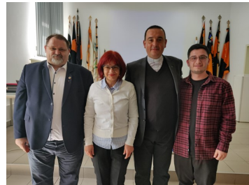
Vorstand, Kolping Rumänien