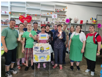
100 Kerzen für die Ukraine